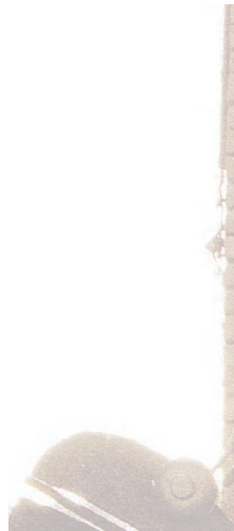
23 Ce discours peut valoir aussi pour les systèmes électroacoustiques et numériques, pas seulement pour des systèmes mécaniques comme les instruments musicaux traditionnels.

Bien sûr, on parle ici de liberté dans le sens de la possibilité d'agir selon volonté et compétence, grâce à un répertoire d'habiletés subjectives et collectives développées par rapport à un cadre de connaissances et de conditionnements culturels. En quelque mesure variable, écouter c'est toujours percevoir les conditions de production et d'existence des événements sonores qui ont lieu et les comprendre en tant que dues aux forces et aux pouvoirs qui les déterminent. En dernière analyse, ce sont les qualités audibles de telles relations de pouvoir qui effectivement structurent la musique (on peut