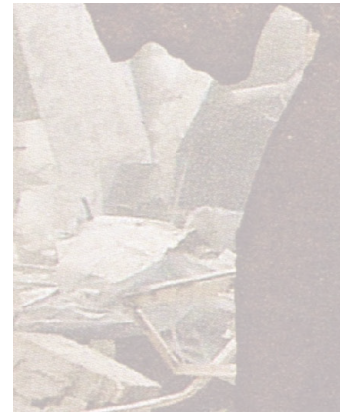
6 Voir, par exemple, Edmond (2009, p. 169-182).