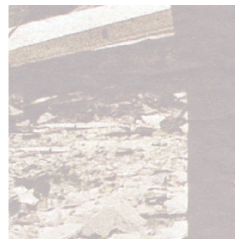
15 Winfried Nöth, « Ecosémiotose », Sign systems studies , n° 26, 1998, cité par Reybrouck (2015, p. 1-26).