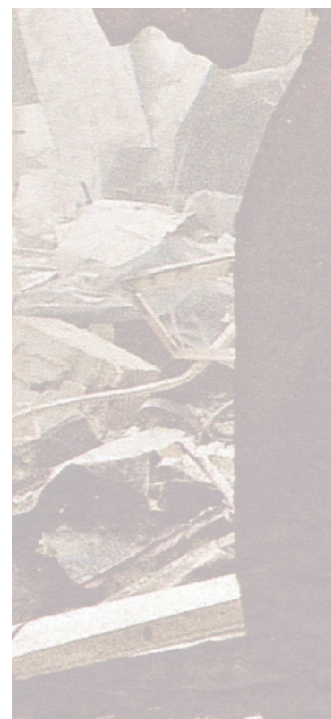
8 Voir aussi Di Scipio (2012, p. 63-70).