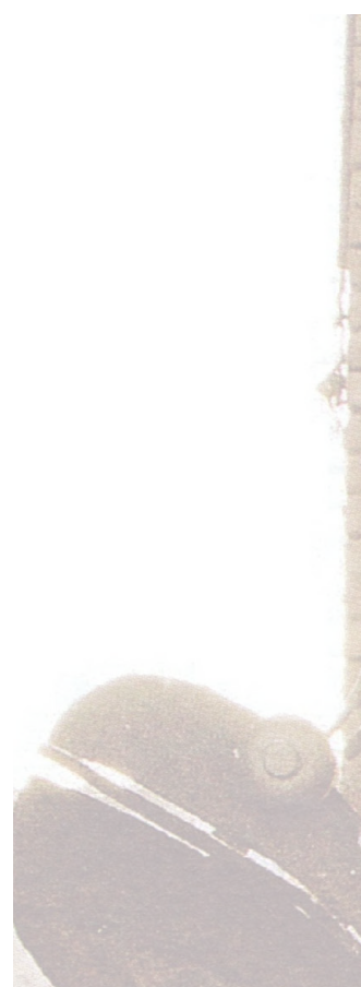
7 Voir, par exemple, Varela (1989).

Depuis longtemps, les écologistes et les biologistes ont observé que « les organismes vivants ont réellement besoin de facteurs aléatoires dans l'environnement, sans lesquelles ils ne peuvent pas vivre » (Hutchinson, 1952, p. 644). Ils ont observé que toute turbulence dans l'environnement fournit aux organes de perception un niveau minimum d'activité qui suffit à les maintenir en fonction. Ainsi, afin de se maintenir en fonction, le système auditif ( pars pro toto