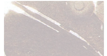
5 Par exemple, lire Charles-Dominique (2008, p. 33-55).

4 Avec « nous » je veux dire, dans cet article, soit auditeurs, soit musiciens et artistes sonores, soit encore théoriciens... Toute division sociale et technique des compétences (et du travail) vient après l'« être à l'écoute ».