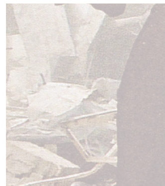
13 NDLR : action de causer ; rapport de cause à effet (def. TLF).