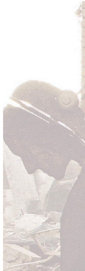
33 Voir Chowning (1992, p. 99-105).

32 La définition donnée par Rousseau remonte à 1767.