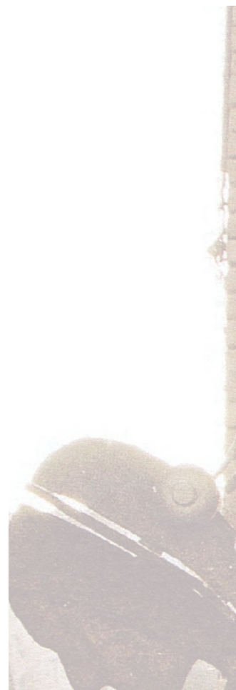
28 Je reprends ici les suggestions que l'on trouve chez Sundberg (1987, p. 157).

Bien que le couplage incarné action-perception fasse justement remonter à l'expérience de la voix et de la parole, Berthoz soutient (en faisant écho à Varela) que le mouvement et l'action sont très probablement à la base des phénomènes cognitifs en général (Godøy, 2001, p. 240), à condition naturellement de penser toute expérience cognitive en tant qu'incarnée. La théorie motrice de la perception, établie à partir du rapport paradigmatique entre